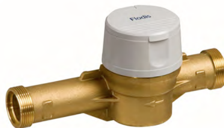
Compteurs Flodis et MSD, certifiés SSIGE et MID

Le partenariat Itron - LaboSafe, qui illustre notre volonté de n'offrir que des prestations de qualité irréprochable, se poursuivra avec le même succès auprès de nombreuses communes et service des eaux de notre pays, grâce à la qualité, la fiabilité et la compétitivité des produits Itron, au travers des réseaux de fidèles clients dans le domaine de l'eau dont bénéficie LaboSafe.